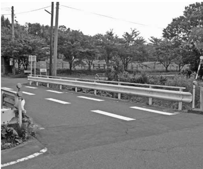
修繕予定の橋(下小竹地内)