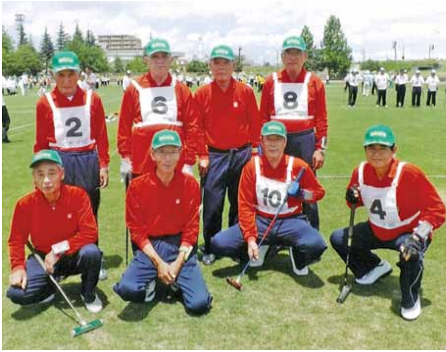
ゲートボールの仲間と

総合大学受講生で先日、新潟日報社新社屋メディアアシッ プ（地上20階建・高さ105m・複合型ビル）を見学して来ま