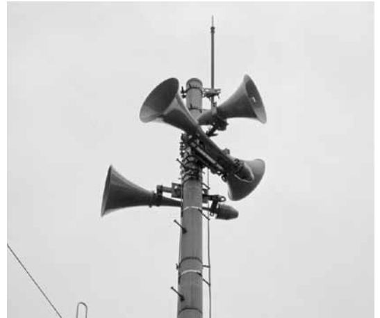
大規模災害時には国から直接放送されます

臨時会では平成24年度一般会計補正予算(第8号)(専決)、平成25年度一般会計補正予算(第1号)や、条例の一部改正など議案6件が提出され、慎重審議の結果、いずれも原案のとおり可決・承認しました。