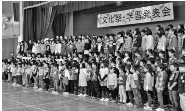
子どもたちの未来のために

答弁 住宅団地、子育て関係、アクセスの整備など、町総合計画の中で見直さなければならぬ事もあり、これからの町の課題を見すえ大胆に、柔軟に対応してまいります。