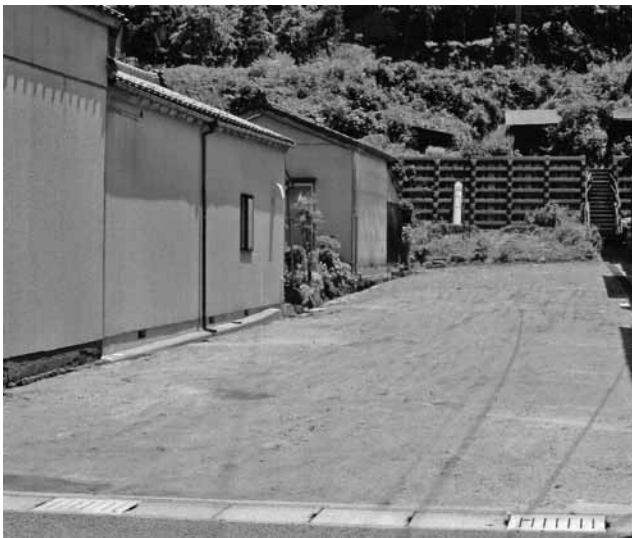
避難道路の予定地 (諏訪本町)

発生した場合の連絡、避難方法、場所についてのマニュアルを作成して、周知する必要があります。と思っています。