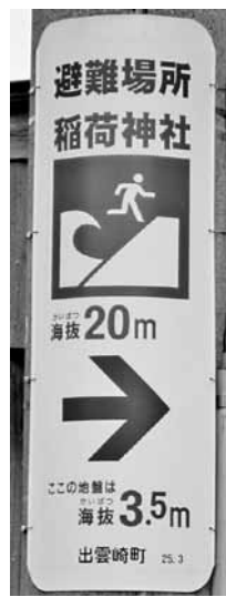
海拔表示 看板 (稲荷町)