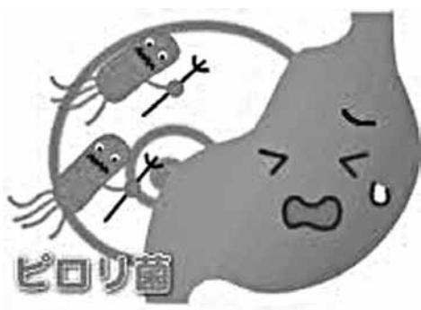
ピロリ菌は胃がんの発症率を高めます

答弁 平成21年の厚生労働省の調査では、全国17市町村でピロリ菌抗体検査がオプションとして、ガン検診の中に取り入れられています。当町規模で行うにはガン検診の検査方法や医療機関との連携、基準を定めるなど現段階では難しく、国、県の検討結果を待ち、それを踏まえて実施していく方向で考えています。