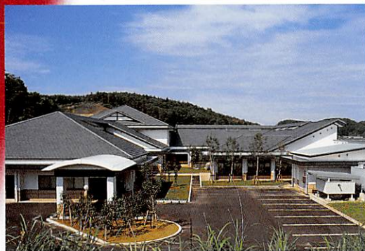
デイサービスセンター TEL41-7155 在宅介護支援センター TEL41-7151

乳幼児の浴室使用料は、無料とします。 浴室以外で使用で、営利又は営業上の目的で使用する場合は、 使用料の5割の額と使用料の合計額を使用料とします。