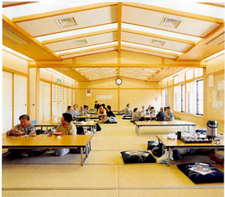
大集会室 休憩室として開放していますが、会議や 研修にもご利用いただけます。