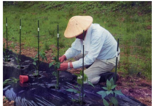
〔支柱を建て紐で固定〕