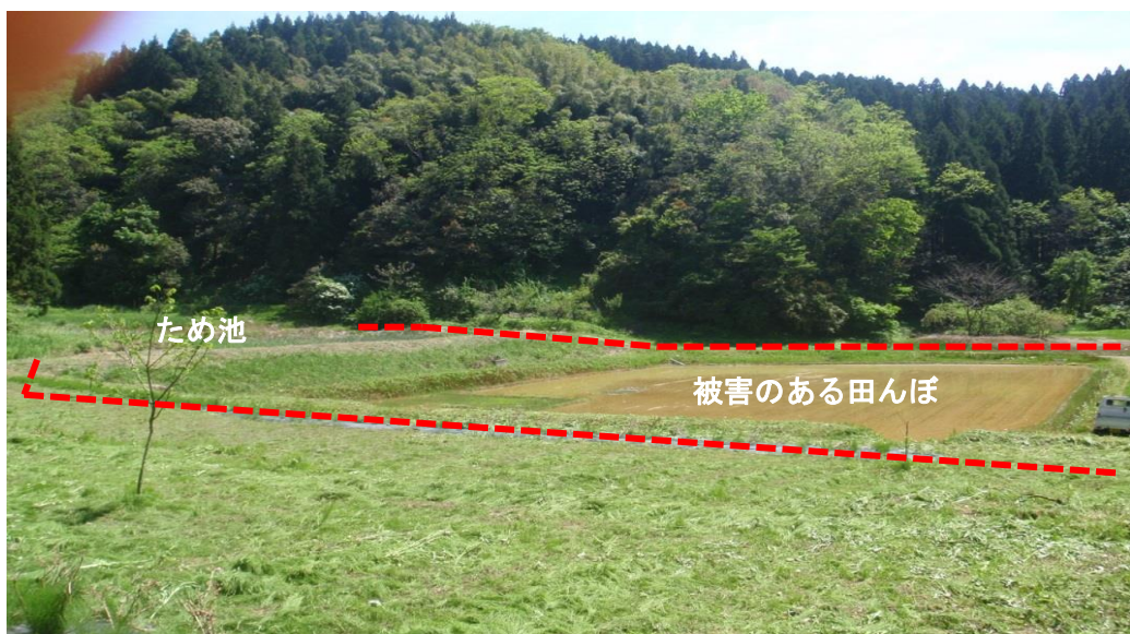
イノシシ被害を受けている田んぼの全景(豊橋地内)