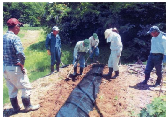
〔マルチング作業後の補正〕