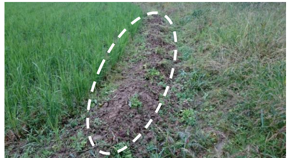
〔イノシシが少し掘った様子〕

既に、成熟しすぎているものもあったが、イノシシ避けを検証するにはやむを得ないところである。全員で株ごと引っこ抜き、約170本を回収、トラックに積みJAのライスセンターに行って摘み取り作業をすることにした。