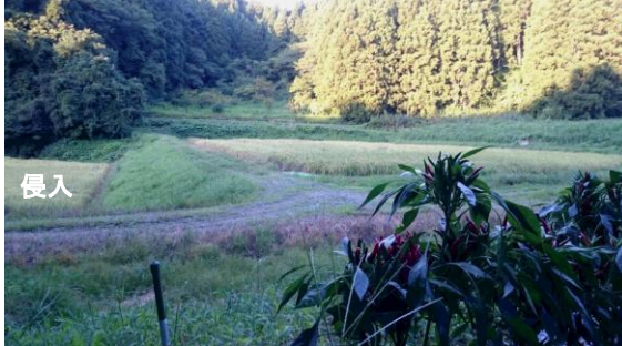
〔写真左部が侵入した田んぼ、左部が唐辛子で囲った田んぼ〕

いよいよ収穫の時期がきた。病気で枯れてしまったものが約10本程度あったがすでに全体は成熟している。10月18日を予定日として待ち望んでいた。もうイノシシは来ないだろうと思っていた。ところが、収穫予定日間近にイノシシが出現した。共済組合、猟友会、役場農林担当等の検証では唐辛子で囲っていた田んぼの一段下にある田んぼに侵入した形跡があるとのことであった。