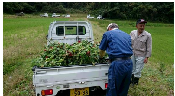
〔トラックに積み込み〕