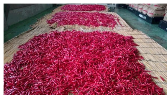
〔摘み取り、乾燥の様子〕