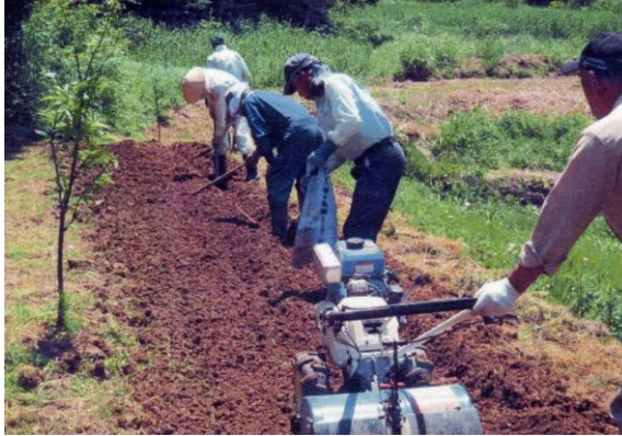
〔堆肥等を播きながらの耕うん作業〕

5月中旬、農業委員と共に畑作りを行った。牛糞堆肥、肥料、石灰を播きながら小型耕運機で耕し、畝を作り、最後は黒フィルムでマルチングを行った。普段桑などは持つこともなく、慣れない動作なので体が痛くなった。連作障害を懸念して、昨年度より少し田んぼ側に畝を作った。