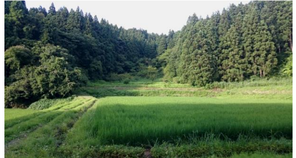
〔7月下旬の唐辛子で囲った田んぼの様子〕

8月上旬になると、実が赤くなるものが少しずつ出てきた。遠くから見てもチラチラ見え隠れする感じであり、ようやく唐辛子が順調に育っている実感が湧いてきた。しかし、このころから、アブラムシや蜘蛛が数か所取りつくようになった。蜘蛛の糸は枝や葉っぱをよじらせているので取り除き、中には自然に蟻がアブラムシを駆除しているものもあったが、念の為、防虫剤を散布してみた。すると、この前までしなっていた枝や葉っぱが元気になってくる。薬の効力とはこういうものなのかわからないが、無農薬で管理することは大変なことのように思えた。8月下旬になるとほぼ全体が赤くなってきた。もう収穫できそうなものもあるが、イノシシが出てくるまではできない。