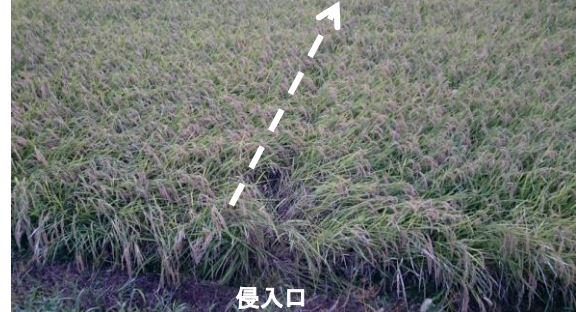
〔イノシシの侵入の跡〕

このあと、唐辛子で囲っていた田んぼの刈取りが行われた。いよいよ収穫日を迎え農業委員と現地で合流した。すると唐辛子で囲っていた田んぼにイノシシの足跡を発見。侵入した形跡があった。まだ唐辛子は収穫していない。唐辛子の畝の付近を探ってみたが近寄った形跡がないことが解った。