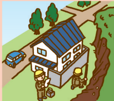
【建築主事を置く地方公共団体等】

建築物の構造規制 居室を有する建築物は、作用すると想定される衝撃等に対して建築物の構造が安全であるかどうか建築確認がされます。