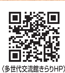
〈多世代交流館きりHP〉